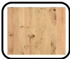
Chêne avec nœuds